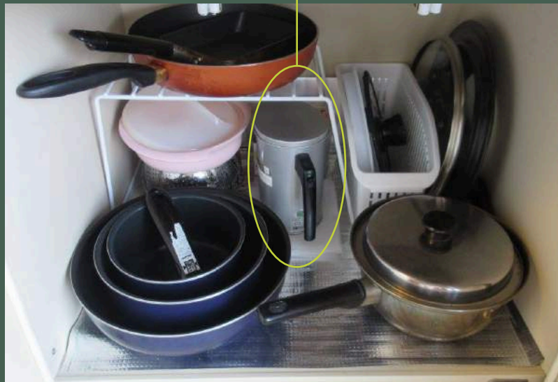
【いい仕事します鍋】