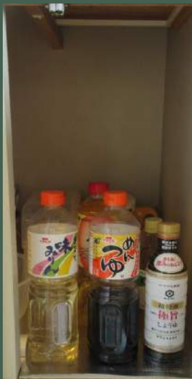
【定番が安心です調味料】