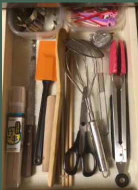
【引出しがいい、内弁慶なキッチンツール】